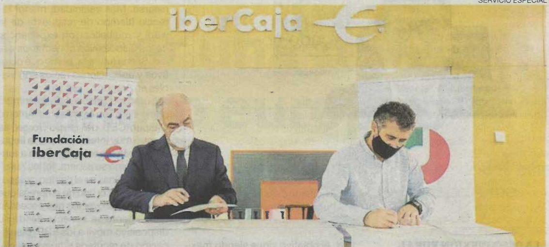
►► El convenio se ha firmado esta semana en la sede de Fundación Ibercaja.

El objetivo de la Escuela de Hostelería TOPI es formar a jóvenes y promover su inserción social, educativa y laboral mediante procesos de enseñanza-aprendizaje que, además de facilitar el acceso a competencias profesionales de las especialidades de cocina y servicio de restaurante y bar, contemplen el desarrollo de competencias que permitan su formación permanente y la participación social. El centro ofrece a jóvenes de entre 16 y 25