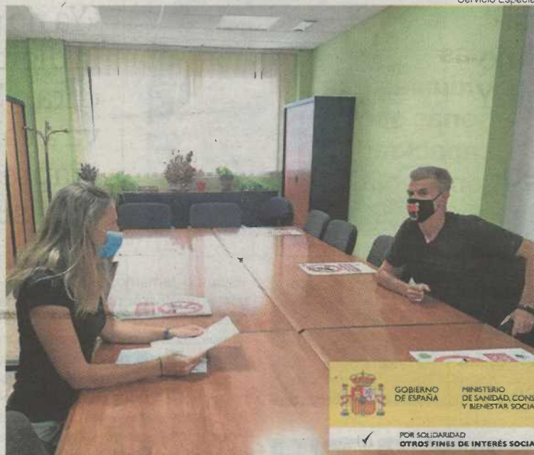
►► Un usuario del programa de reclusos es atendido por plena inclusión Aragón.

gón ayuda a los presos a volver a tener una vida normal en la sociedad cuando salen de la cárcel.