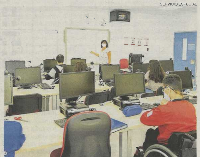
► Aula de los Programas de Cualificación Inicial de la Fundación DFA.

Ahora, el proyecto se retoma en un nuevo curso marcado por las medidas de seguridad, imprescindibles para evitar el contagio y propagación de la enfermedad: Masca-