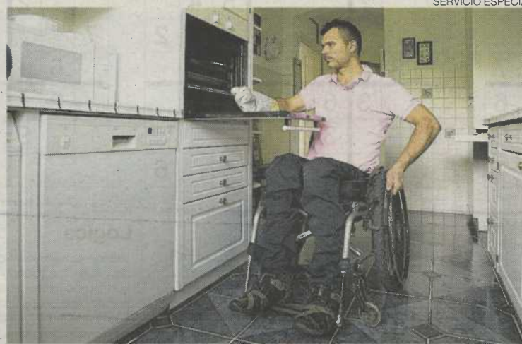
► Imagen adquirida en Shutterstock sobre accesibilidad en vivienda.

Podrán ser destinatarios de estas ayudas: